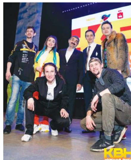
Команда КВН «Элеконд» и актер сериала «Реальные пацаны» Армен Бежанян